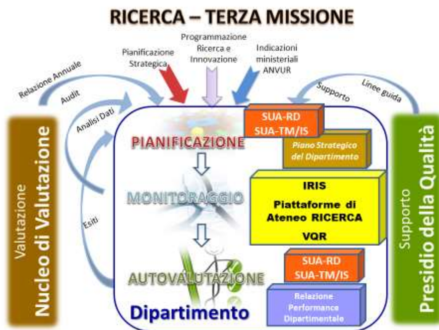
Figura 5. Schema funzionale sistema di AQ – Ricerca e Terza Missione

In tale ambito, le attività di AQ, in stretta connessione con gli obiettivi strategici, le azioni attuative e il monitoraggio degli indicatori strategici dell'area, vengono concertate e attuate con la supervisione e il coordinamento dei Delegati del Rettore per la Ricerca, per la Progettazione della Ricerca, per i Laboratori e le Infrastrutture di Ricerca, per i Dottorati di Ricerca, per il Trasferimento Tecnologico, per la Missione Sociale.