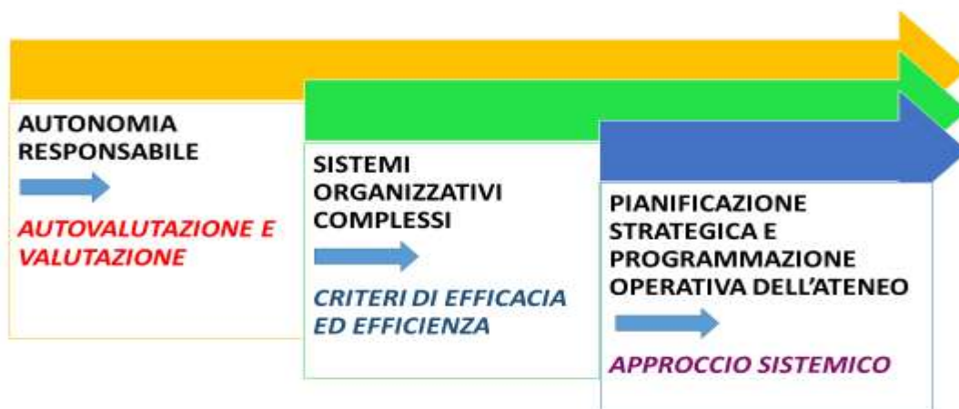
Figura 2. Fattori a sostegno dell'Assicurazione della Qualità