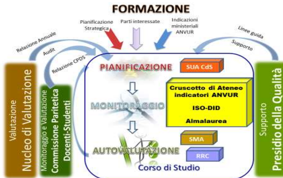
Figura 4. Schema funzionale sistema di AQ – Formazione